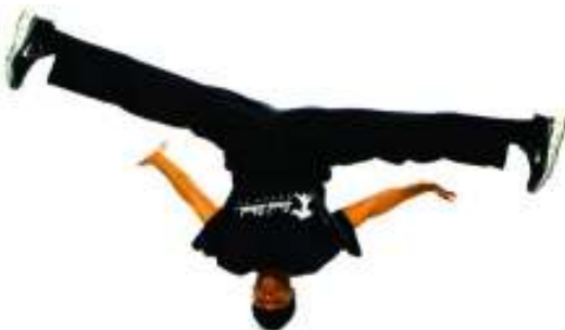
By Domcza Kapustová

Jsou lidé, kteří tento tanec odmítají a ani ho neberou jako tanec. Ale i tento tanec je druh umění, které zase jiným lidem přijde jako ten správný pohyb, který si zamilovali. Lidé se většinou dělí na tři tábory s názory na street dance. Jedna skupina street dance a hudbu na kterou se tančí nesnáší a odmítá. Druhá skupina neví přesně, co si pod tím představit a k hudbě má neutrální postoj, něco se jim líbí více, něco méně. A třetí skupina si street dance zamilovala a stal se součástí jejich života.