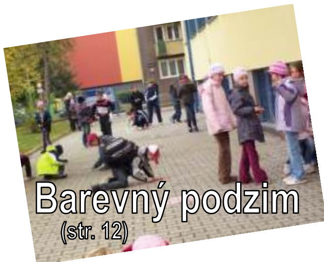
Barevný podzim (str. 12)