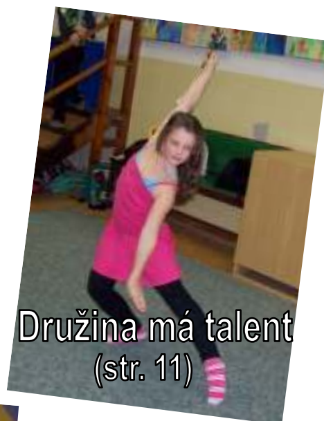
Družina má talent (str. 11)