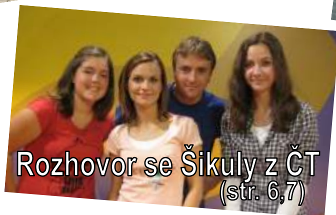
Rozhovor se Šikuly z ČT (str. 6,7)